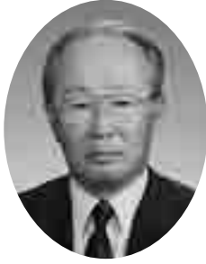
会 頭 島 一